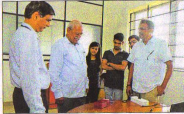
ಮಂಗಳೂರಿನ ಸಹ್ಯಾದ್ರಿ ಎಂಜಿನಿಯರಿಂಗ್ ಕಾಲೇಜಿಗೆ ಭೇಟಿ ನೀಡಿದ ಕೇಂದ್ರ ಸಚಿವ ರಮೇಶ ಜಿಗಜಿಣಿಗೆ, ಸ್ವಚ್ಛತೆಯ ಜಾಗೃತಿ ಮೂಡಿಸುವ ಕಾಲಿಂಗ್ ಬೆಲೆ ವೀಕ್ಷಿಸಿದರು.

ಕಾಲೇಜಿನ ವಿದ್ಯಾರ್ಥಿಗಳ ಪ್ರತಿಭೆ ಹೊಸ ಪರಿಕಲ್ಪನೆಗಳನ್ನು ಶ್ಲಾಘಿಸಿದ ಜಿಗಜಿಣಿಗೆ, ಕೇವಲ 10 ವರ್ಷಗಳಲ್ಲಿ ಸಂಸ್ಥೆಯ ಪ್ರಗತಿ ಹಾಗೂ ವಿದ್ಯಾರ್ಥಿಗಳಿಗೆ ನೀಡಿದ ಪ್ರೋತ್ಸಾಹವನ್ನು ಮೆಚ್ಚಿದರು.